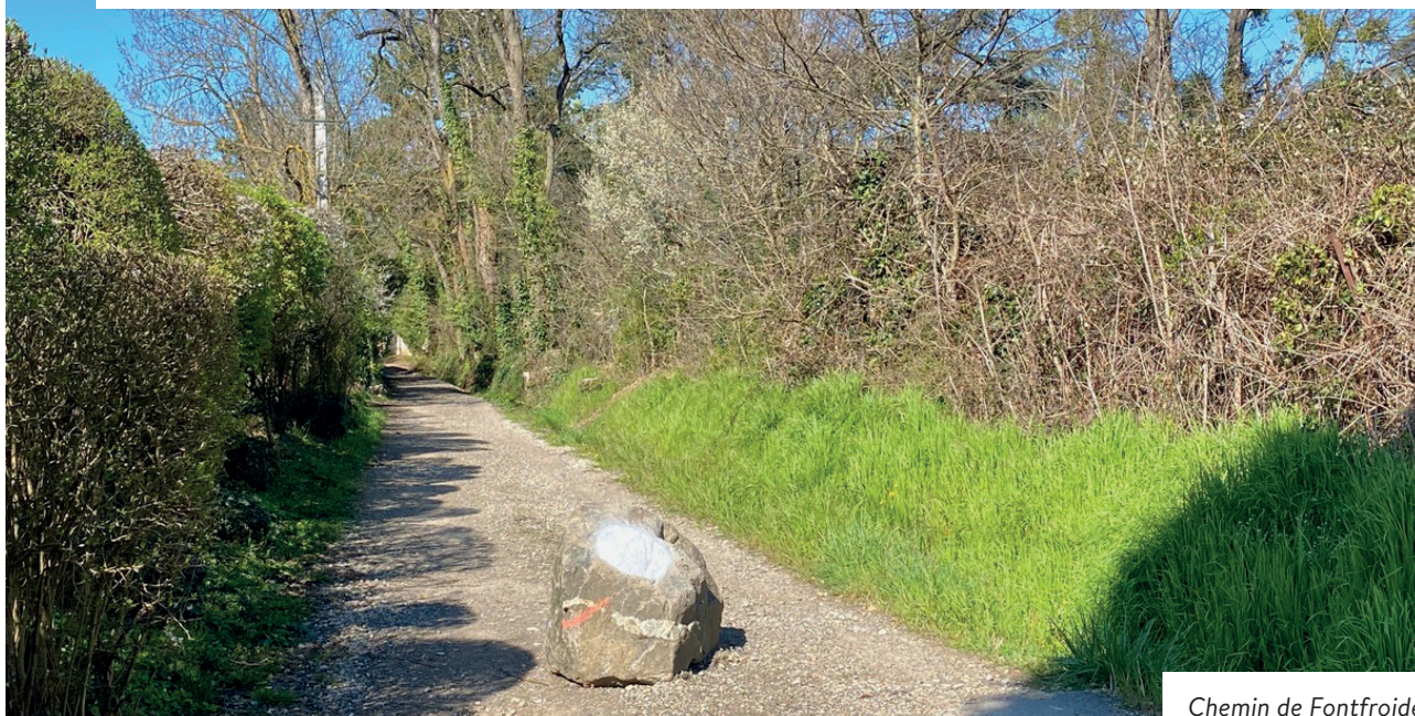
Chemin de Fontfroide

Au fil du temps, le chemin de Fontfroide a connu une fréquentation croissante, avec une augmentation notable du nombre de véhicules, dont certains sans lien direct avec le secteur. Des véhicules de livraison y circulaient également, parfois à des vitesses inadaptées à la configuration des lieux.