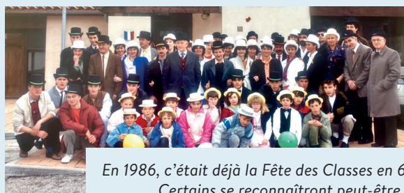
En 1986, c'était déjà la Fête des Classes en 6. Certains se reconnaîtront peut-être...

À cause de son origine militaire, la Fête des Classes était autrefois réservée aux hommes. Elle s'adresse désormais à toutes et tous. Elle est devenue l'occasion