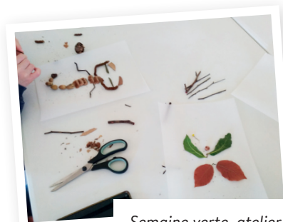
Semaine verte, atelier Pepsi Héros