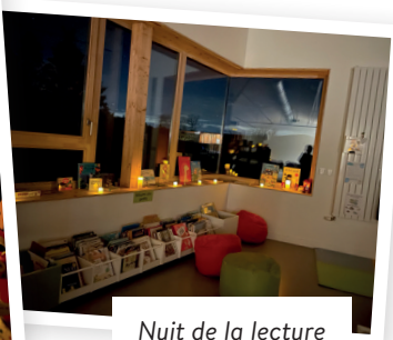
Nuit de la lecture