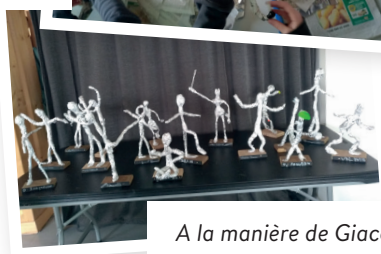
A la manière de Giacometti