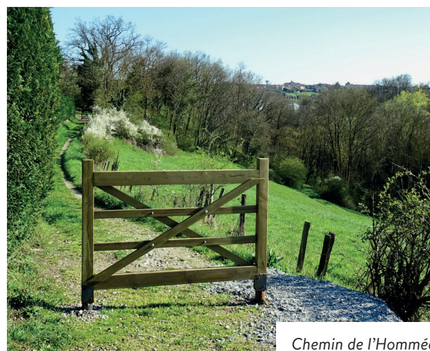
Chemin de l'Hommée

Des barrières avaient toutefois été installées, permettant d'ouvrir ponctuellement ce chemin à la circulation en cas de besoin, notamment pour l'accès des secours. Malheureusement, des personnes malveillantes les ont démontées et dérobées. Outre le coût engendré pour la collectivité, la Commune a donc dû les remplacer par des rochers.